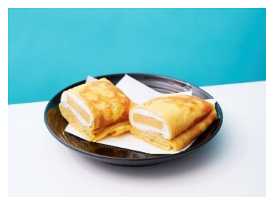
■まぐろ問屋三浦三崎港 恵み お寿司屋さんの出汁巻きクレープ/490円