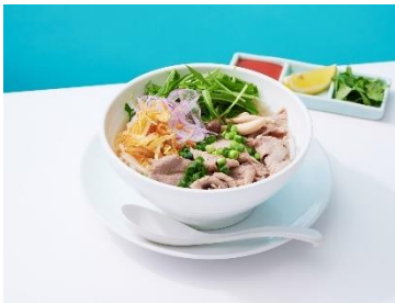
■アジアダイニング PRIMO フォーボー(牛肉のフォー)/1,200円