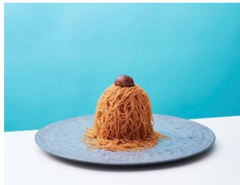
■サブリーナ パスタ&クラムチャウダー 生搾りモンブラン/1,650円