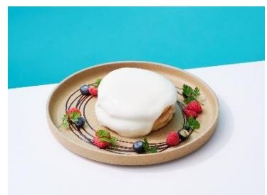
■モダンメキシカン マヤルス ベリーとアガベクリームのパンケーキ/1,180円