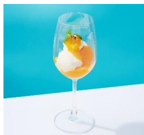
■宮崎料理 万作 ヘルシー豆乳パンナコッタ/780円