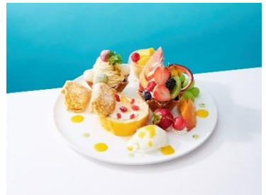
■果実園リーベル 彩り果実パーティープレート/2,300円