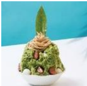
■茶寮伊勢 藤次郎 藤次郎氷/1,408円