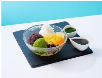
■牛たん炭焼 利久 宮城の伊達茶を使用した伊達茶大福入りクリームあんみつ/550円