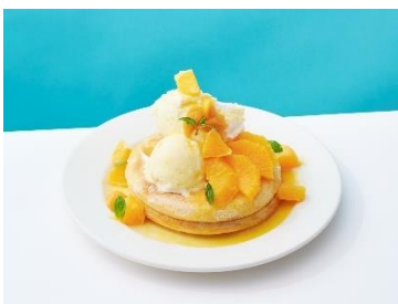
■Cafe & Grill SIZZLe GAZZLe マンゴーとオレンジのパンケーキ/1,580円