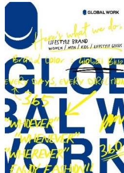
※<グローバルワーク> イメージ