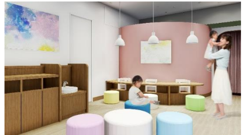
※ベビー休憩室イメージ

たまプラーザ店はコロナ禍を経て変化した新たな価値観に対応し、地域のお客さまがさらに日常生活を楽しめる提案を行うことと、ファミリーで過ごす場になることを目指し、段階的に改装を実施してまいりました。