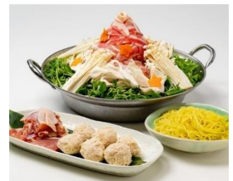
※写真は 2 人前です