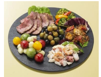
※写真は盛り付けの一例です

人気のシーフードマリネや、お酒と相性の良いミックスオリーブをはじめ、ローストビーフやカポナータ、ポッコンチーニカプレーゼなどが入ったクリスマスにぴったりの聖夜を彩るオードブルです。(W31×D22×H6.5cm)