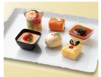
※写真は盛り付けの一例です