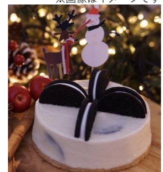
※画像のクリスマストッピングはイメージです

【販売場所】地下2階 フードステージ (cafe The SUN LIVES HERE)