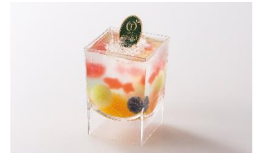
＜新宿高野＞ フルーツアクア 540円

ラムネ風味と希少糖のジュレ（希少糖約0.7%配合）に果実と金魚の形の苺ジュレを閉じ込めた爽やかな味わいのデザート。