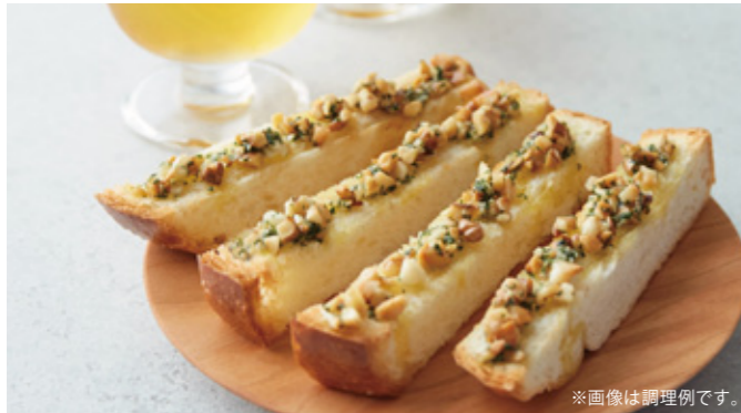
※画像は調理例です。

【調理例のご紹介】大葉とナッツのガーリックスティック ビールのお供にもぴったりの、ガーリックがきいた手軽なスティック。 アンデルセンイギリスを細かくカットしてトーストすることで、サクサクの食感に。 ガーリックの味わいに、大葉とナッツがアクセント。