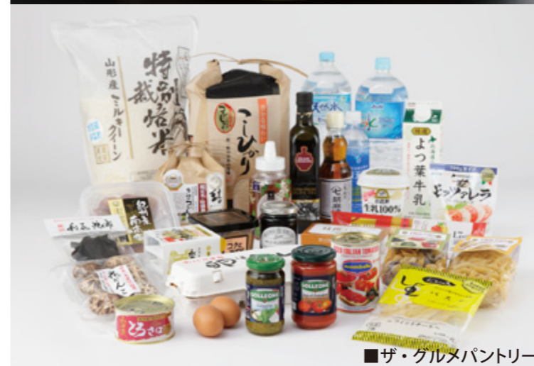
■ザ・グルメパントリー